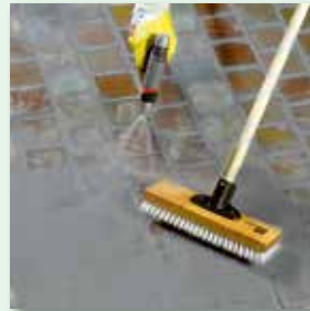
diagonal zur Fuge abreinigen