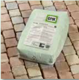
Flächen rückstandsfrei reinigen