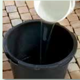
max. 4,5 l Wasser vorlegen