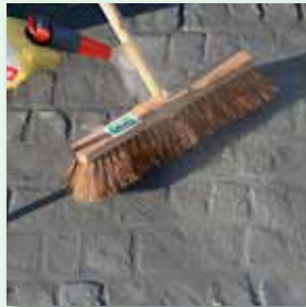
Erhärten des Mörtels auf der Oberfläche vermeiden